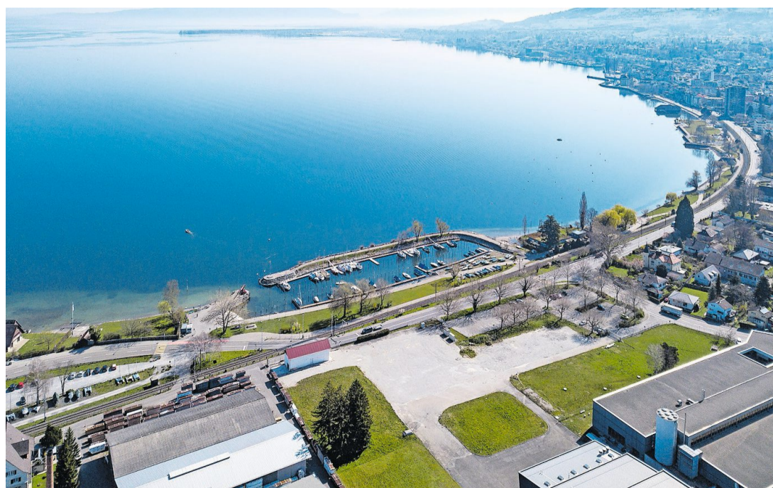
Auf dem Areal vis-à-vis des Goldacher Hafens soll das neue Seewasserwerk Riet II gebaut werden. Das Land ist im Besitz der Stadt St. Gallen. Sie will es der Regionalen Wasserversorgung St. Gallen AG im Baurecht abgeben.

Das Grundstück, das sich als ideal für den Bau des Seewasserwerks Riet II in Goldach erwiesen hat, befindet sich im Eigentum der Stadt St. Gallen. Um das Grundstück einer maximal sinnvollen Nutzung zuzuführen, wurde ein für den sinnvollen Betrieb des neuen Seewasserwerks notwendiges Teilgrundstück abparzelliert, wobei auch eine Fläche für eine zukünftige Erweiterung des Seewasserwerks Riet II vorgesehen ist. Geht es nach dem Stadtrat, erteilt die Stadt St. Gallen der RWSG zulasten des Grundstücks in Goldach ein Baurecht für eine Fläche von 12'924 Quadratmetern. Auch darüber entscheidet das Stadtparlament an seiner Sitzung Ende August.