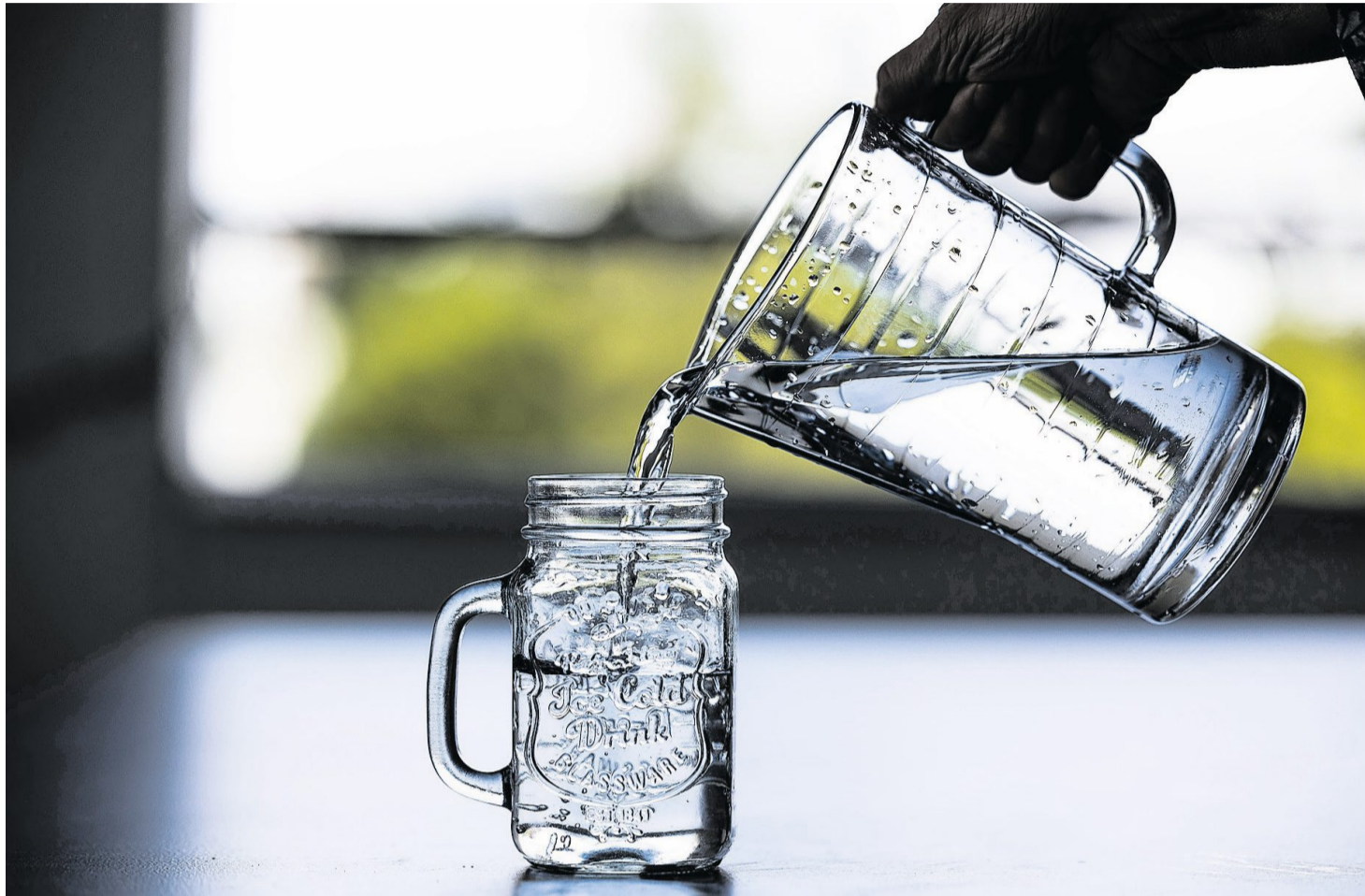
Pro Person werden die Wasserkosten in der Stadt St. Gallen zwischen 20 und 26 Franken im Jahr ansteigen.